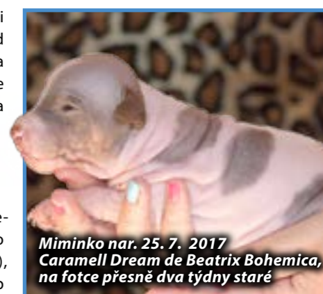
Miminko nar. 25. 7. 2017 Caramell Dream de Beatrix Bohemica, na fotce přesně dva týdny staré