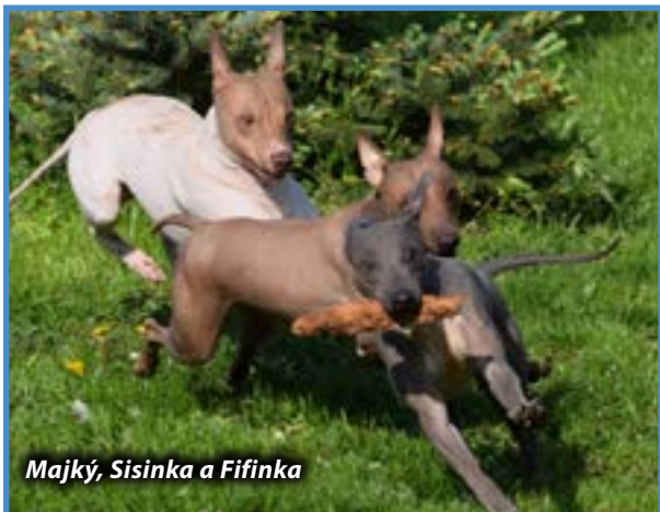
Majký, Sisinka a Fifinka